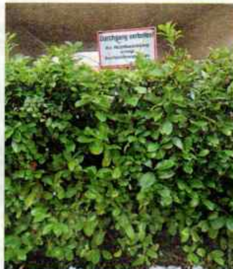
Besser unsportlich. St. Johann im Pongau (S): Wer nicht so fit ist, dass er die Hecke überspringen kann, braucht keine Klage zu fürchten.