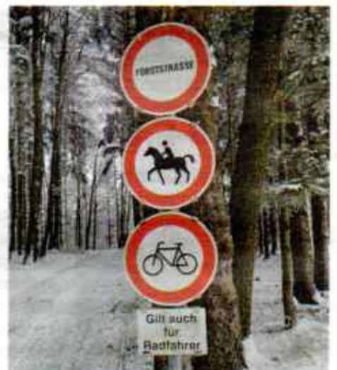
Schilder-Wald. Manning (OÖ): Allgemeines Fahrverbot, Reitverbot und auch Radfahren ist verboten – sogar für Radfahrer:innen.