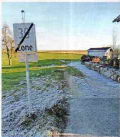
Gib Gast Ernstshofen (NO): Na endlich! Ab hier darf wieder auf 50 km/h beschleunigt werden. Denn noch befinden wir uns im Ortsgebiet.