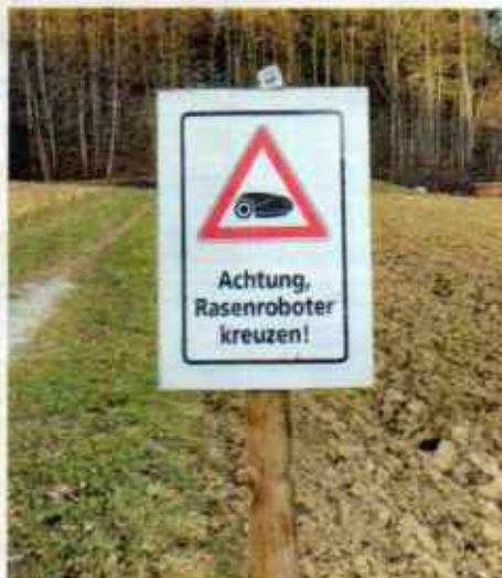
Gute Frage. Stainz (Stmk.): Sind Rasenroboter hier geländetauglich – oder säen sie gar vor Saisonbeginn den Rasen neu?