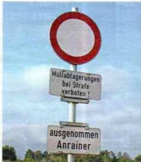
Legales Littering. Strasshof an der Nordbahn (NO): Wer hier wohnt, darf seinen Müll sogar gleich am Straßenrand entsorgen.

Senden Sie Ihre Bilder per E-Mail an: autotouring.redaktion@oeamtc.at