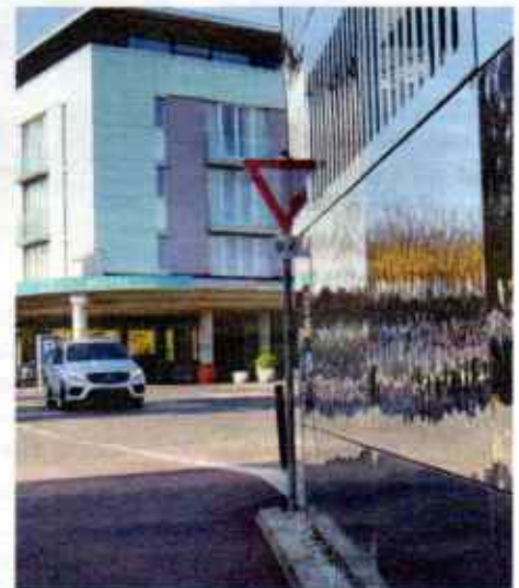
Spiegel-Trick. Velden am Wörthersee (Ktn.): Weil zu wenig Platz für das Vorrangschild war, verspiegelte man halt die Fassade.