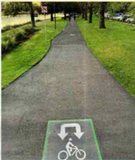
Wende-Punkt. Melbourne (Australien): Absicht oder Planungsfehler? Da radelt man auf einem tollen Radweg – und muss abrupt umkehren.

Senden Sie Ihre Bilder per E-Mail an: autotouring.redaktion@oeamtc.at