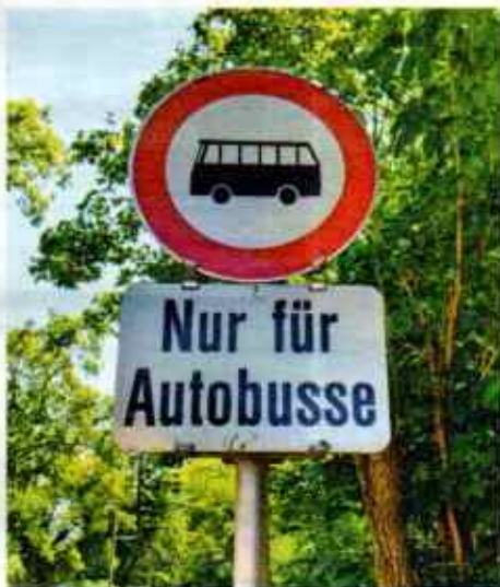
Beipackzettel. Mödling (NÖ): Damit es in der Hinterbrühl zu keinen Missverständnissen kommt, wird gleich eine Erklärung mitgeliefert.