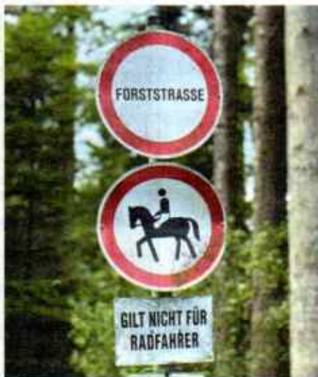
Sattel ist nicht Sattel. Pfarrkirchen (OÖ): Hoch zu Pferd im Sattel ist verboten, auf dem Sattel des Fahrrads zu reiten, ist hingegen erlaubt.