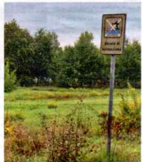
Gesünder leben. Barberino di Mugello (Italien): Von einem Köpfler in die Wiese wird hier ganz dringend abgeraten.