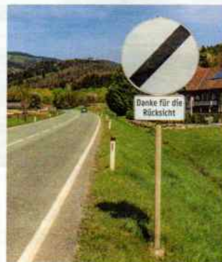
Anger (Stmk.). Eine freundliche Geste am Straßenrand: Hier bedankt man sich bei allen, die rücksichtsvoll die StVO einhalten.