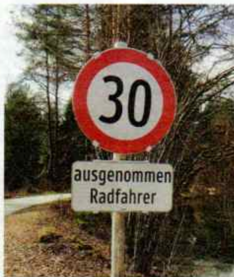
Keutschach (Ktn.). Egal ob E-Bikes oder Muskel-Bikes, wer kraft seiner Wadln schneller kann, der darf das auch.