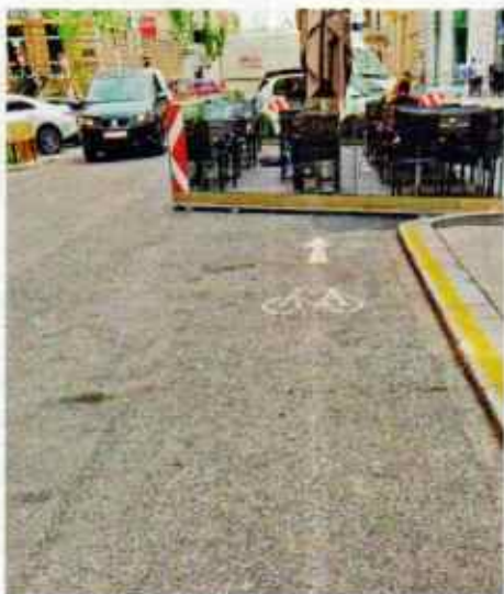
Wien. Wer mit dem Rad kommt, wird direkt in den Schanigarten geleitet – wenn da nicht Stufe und Glasabspernung wären.