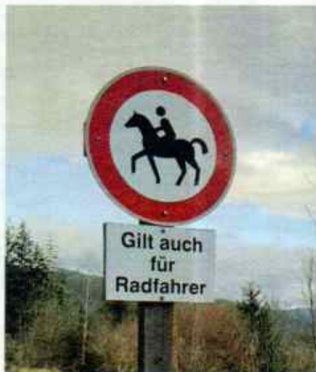
Wartberg (Stmk.). Bis hierher radeln – aber nicht weiter, denn auch das Reiten von Drahteseln ist ab da nicht erlaubt.

Senden Sie Ihre Bilder per E-Mail an: autotouring.redaktion@oeamtc.at