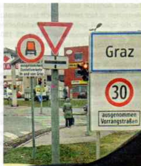
Graz. Wer findet die Ampel? Das ist das Suchspiel für alle, die in Selersberg vom Bahnhof an diese Kreuzung kommen.