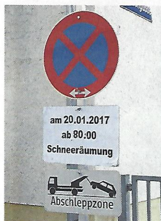
Klagenfurt. Hat nicht einmal irgendjemand gesagt, in Kärnten gehen die Uhren anders?