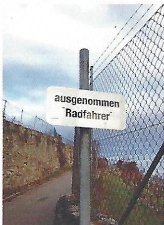
Klosterneuburg. Was ist da alles verboten? Egal, Radler dürfen hier eh machen, was sie wollen.