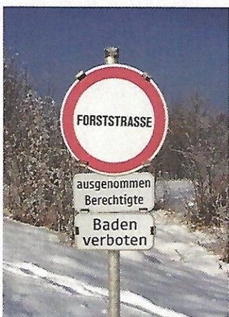
Nussdorf am Attersee. Der Verein „Verkühle dich täglich“ muss sich einen neuen Seezugang suchen.