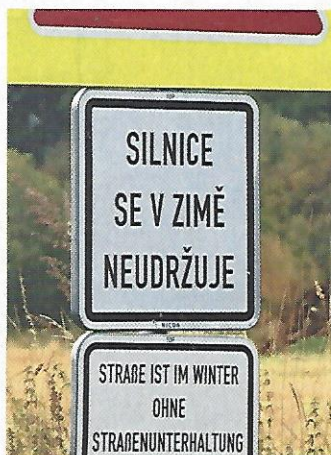
Marienbad. Gute Unterhaltung! Auf dieser Straße gibt's die aber leider nur im Sommer.