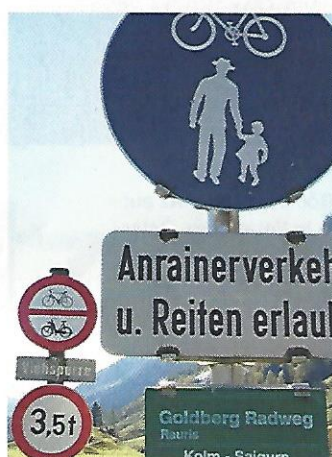
Rauris. Der Radweg durch das Tal ist nur ein kurzes Stück befahrbar. Reiten aber ist erlaubt.

Senden Sie Ihre Digitalbilder per E-Mail an: autotouring.redaktion@oeamtc.at