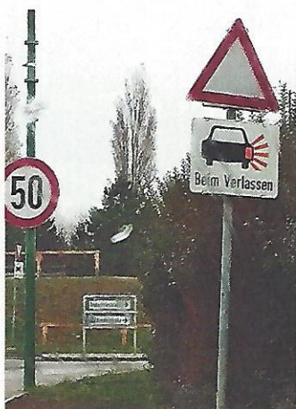
Guntramsdorf. Eine unbekannte Gefahr vor dem Kreisverkehr? Oder ein verpatzter Nachrang?